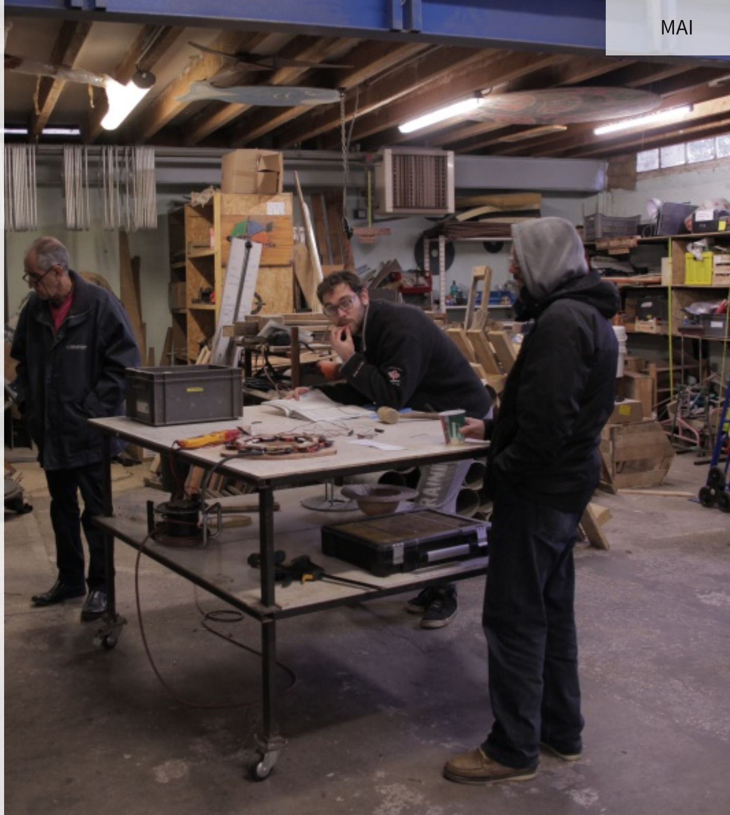
Photo : Le Valence Atelier Libre, le 1 mars 2017

A Lyon, nous découvrons le tout jeune Alternatibar, café plein de ressources où l'objectif est de réussir