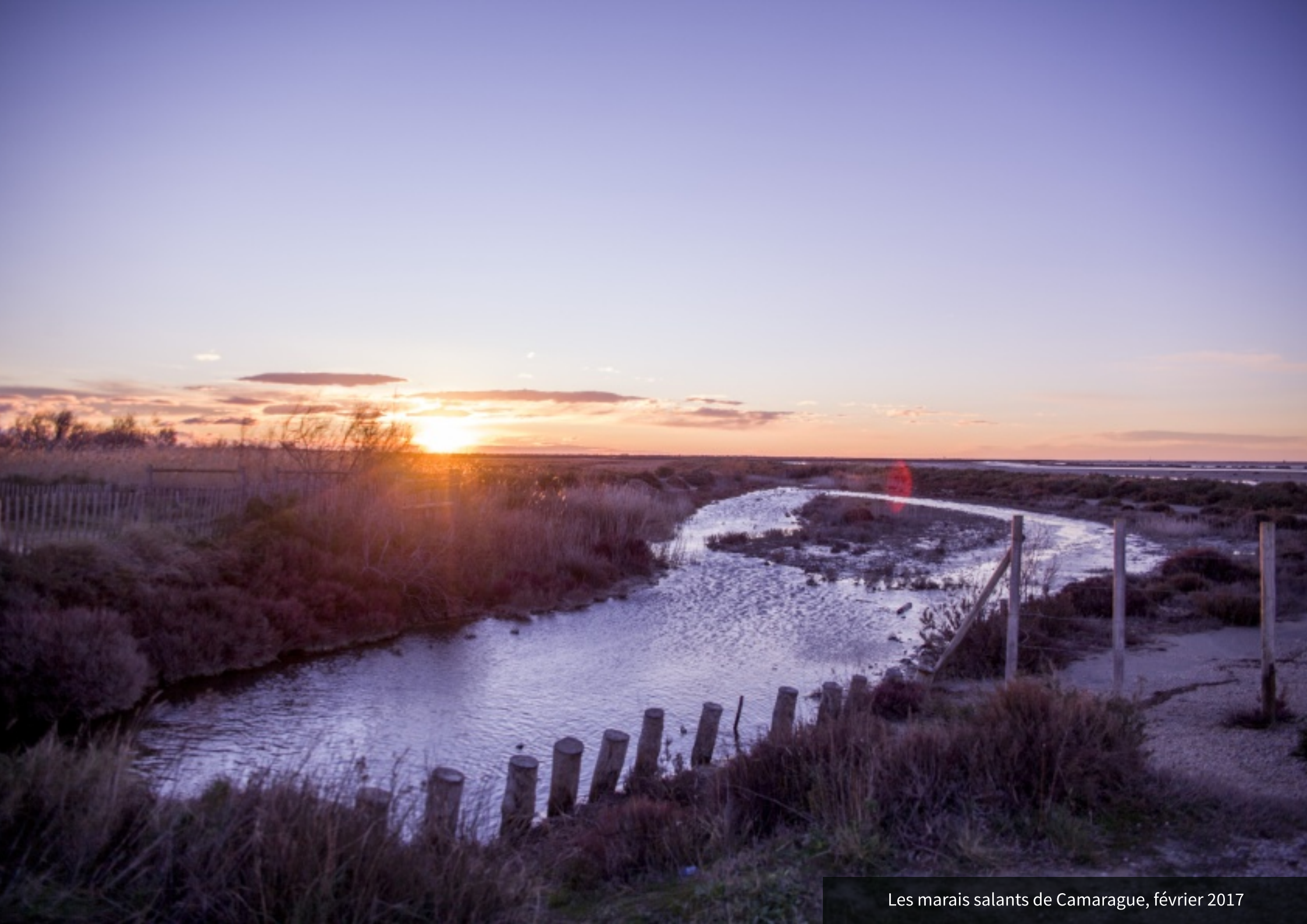
Les marais salants de Camarague, février 2017