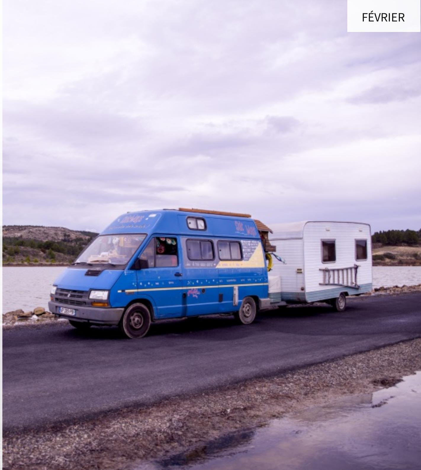
Photo : Route entre les lacs de Narbonne, février 2017

Si on nous accorde finalement l'autorisation de rester, nous sommes repartis sur les routes avec une pensée pour tous ceux dont l'apparence fait ressortir les préjugés malsains des gens "qui font les choses comme il faut" : roms, gens du voyage et autres saisonniers.