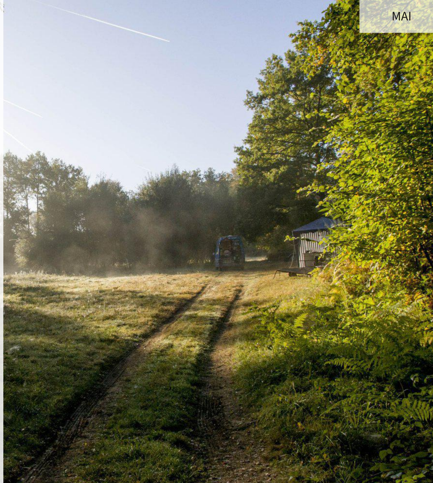
Photo : La serre de la ferme des Bouillons, le 3 juillet 2015