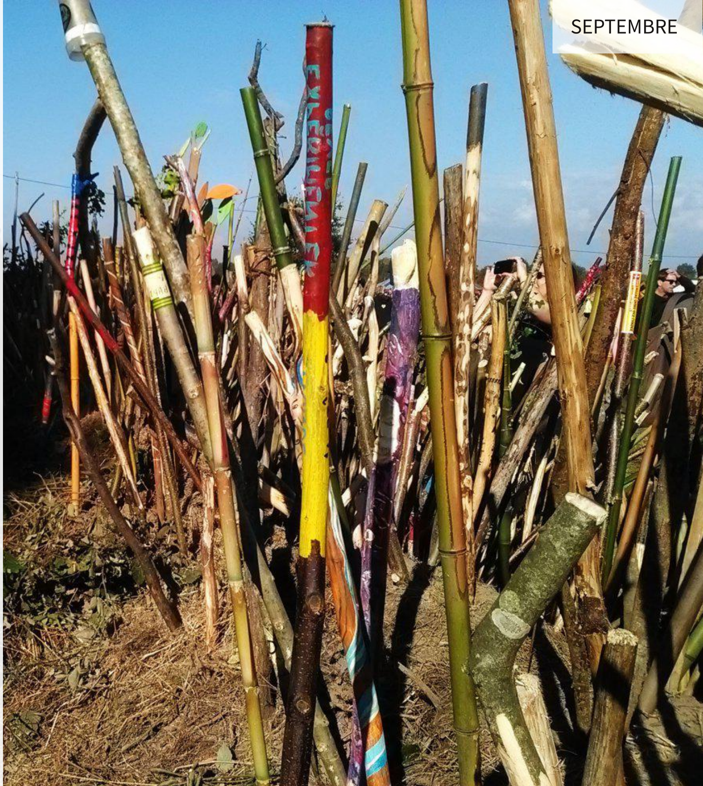
Photo : Les bâtons plantés pendant la manifestation du 8 octobre 2016 à Notre-Dame-des-Landes

Nous travaillons peu sur les prochains épisodes à monter. Nous aurons l'hiver pour la post-production et nous voulons avancer autant que possible sur le chantier avant de partir vers le sud.