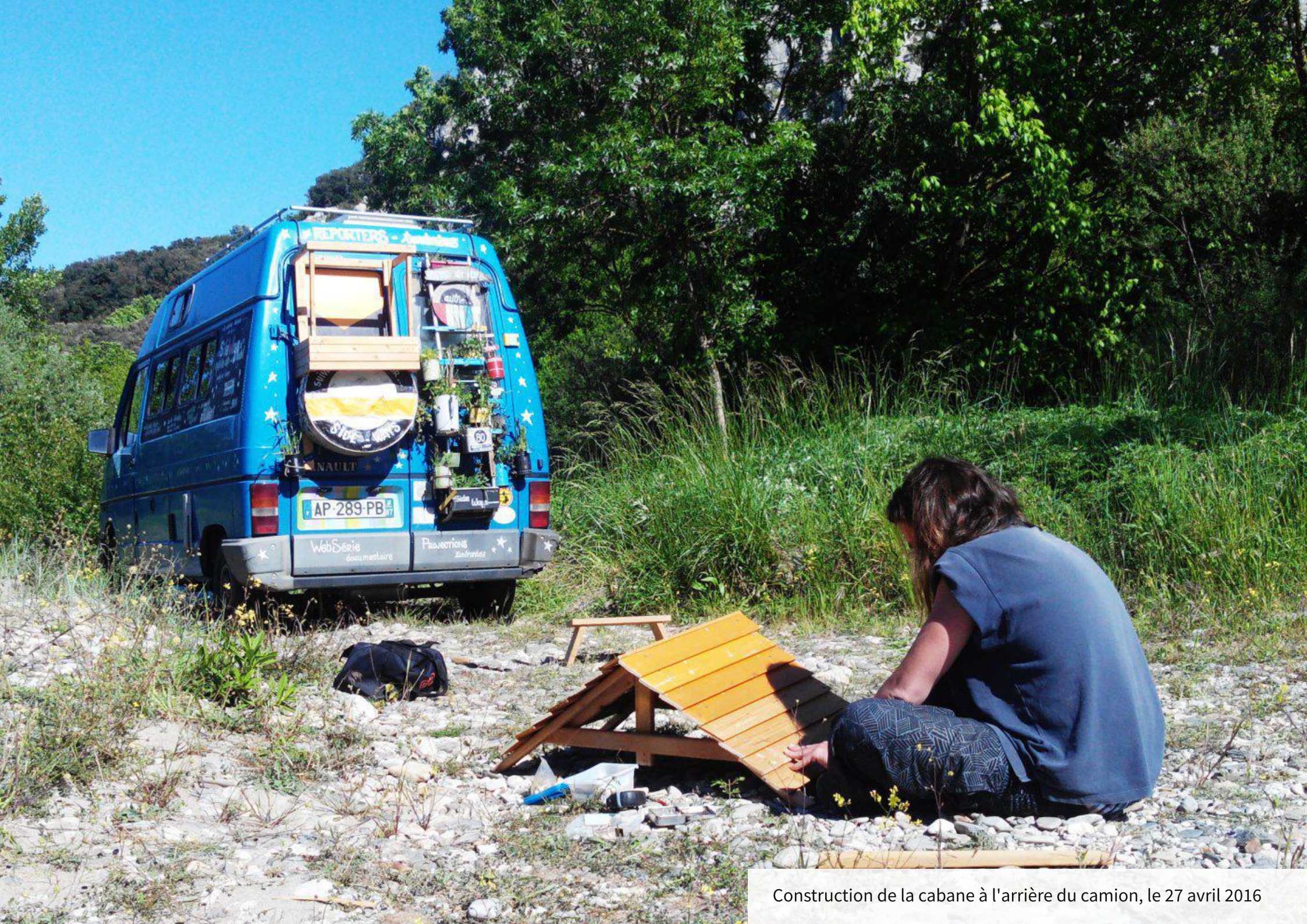
Construction de la cabane à l'arrière du camion, le 27 avril 2016