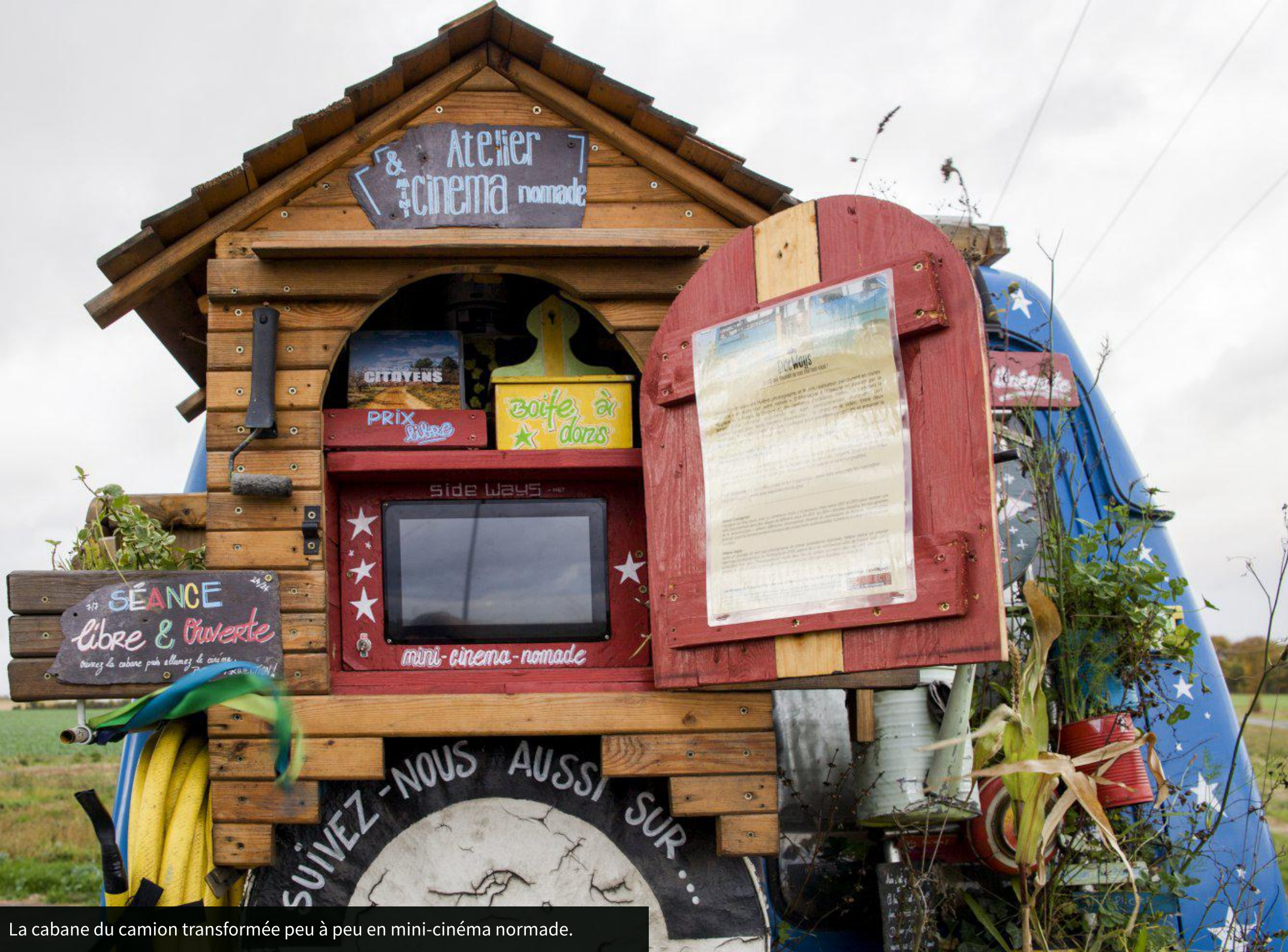
La cabane du camion transformée peu à peu en mini-cinéma normade.