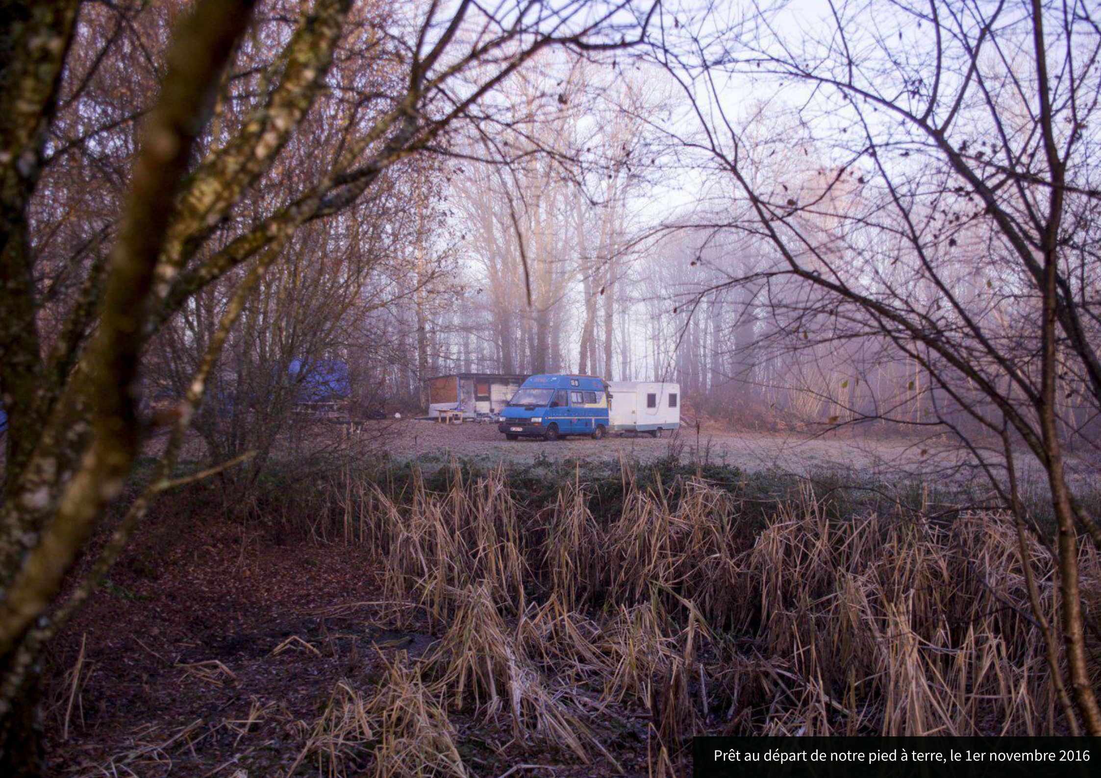
Prêt au départ de notre pied à terre, le 1er novembre 2016