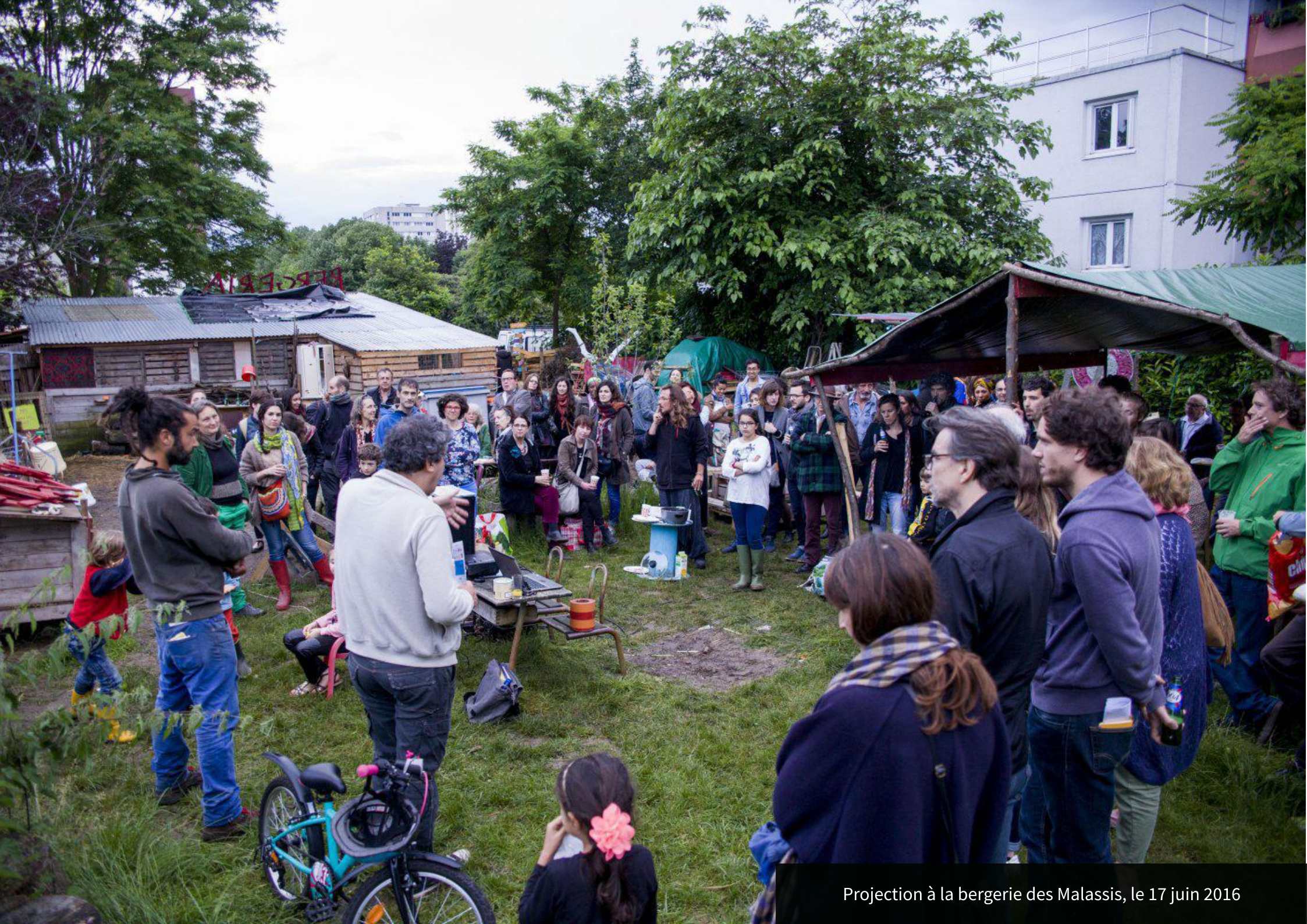
Projection à la bergerie des Malassis, le 17 juin 2016