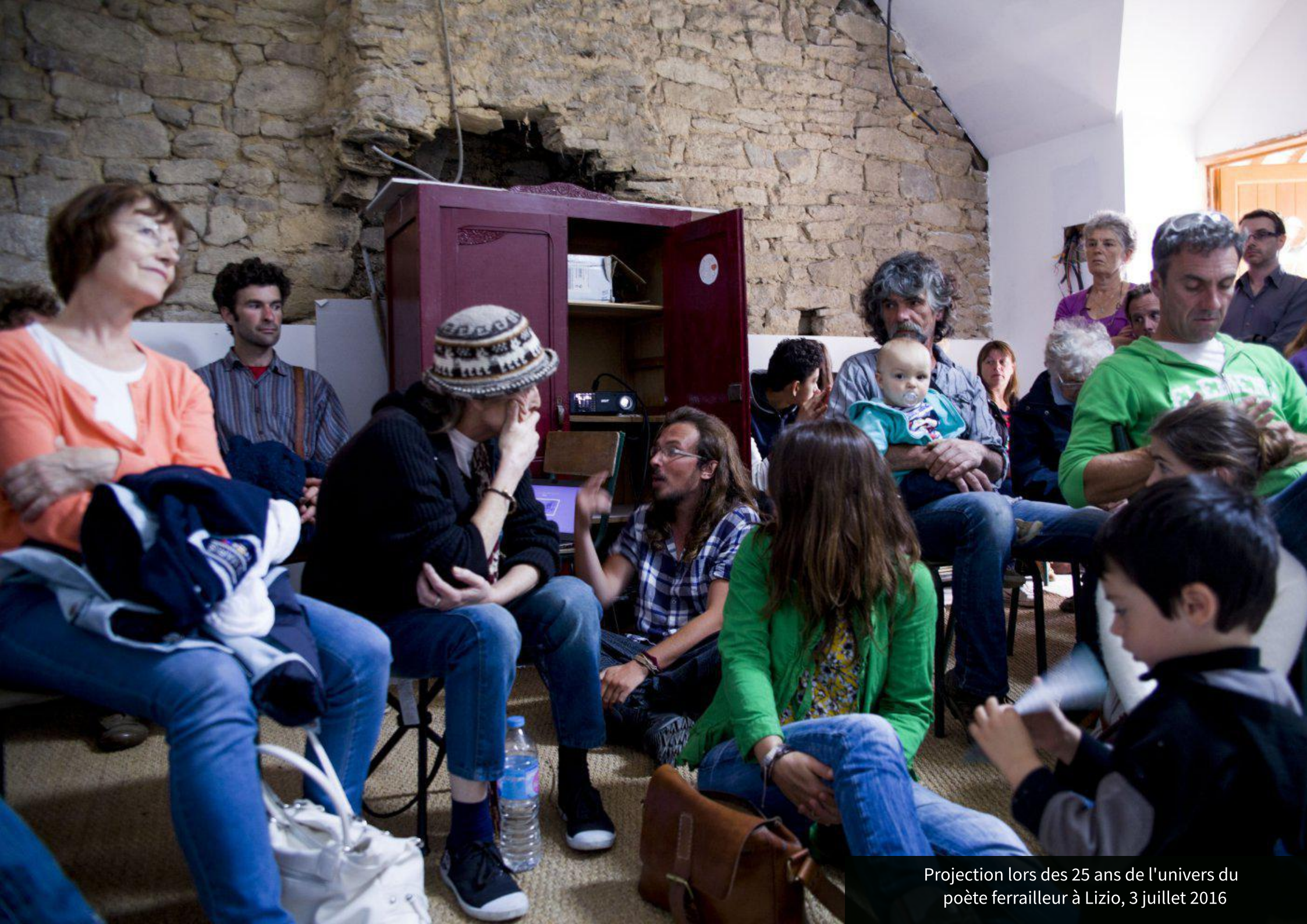
Projection lors des 25 ans de l'univers du poète ferrailleur à Lizio, 3 juillet 2016