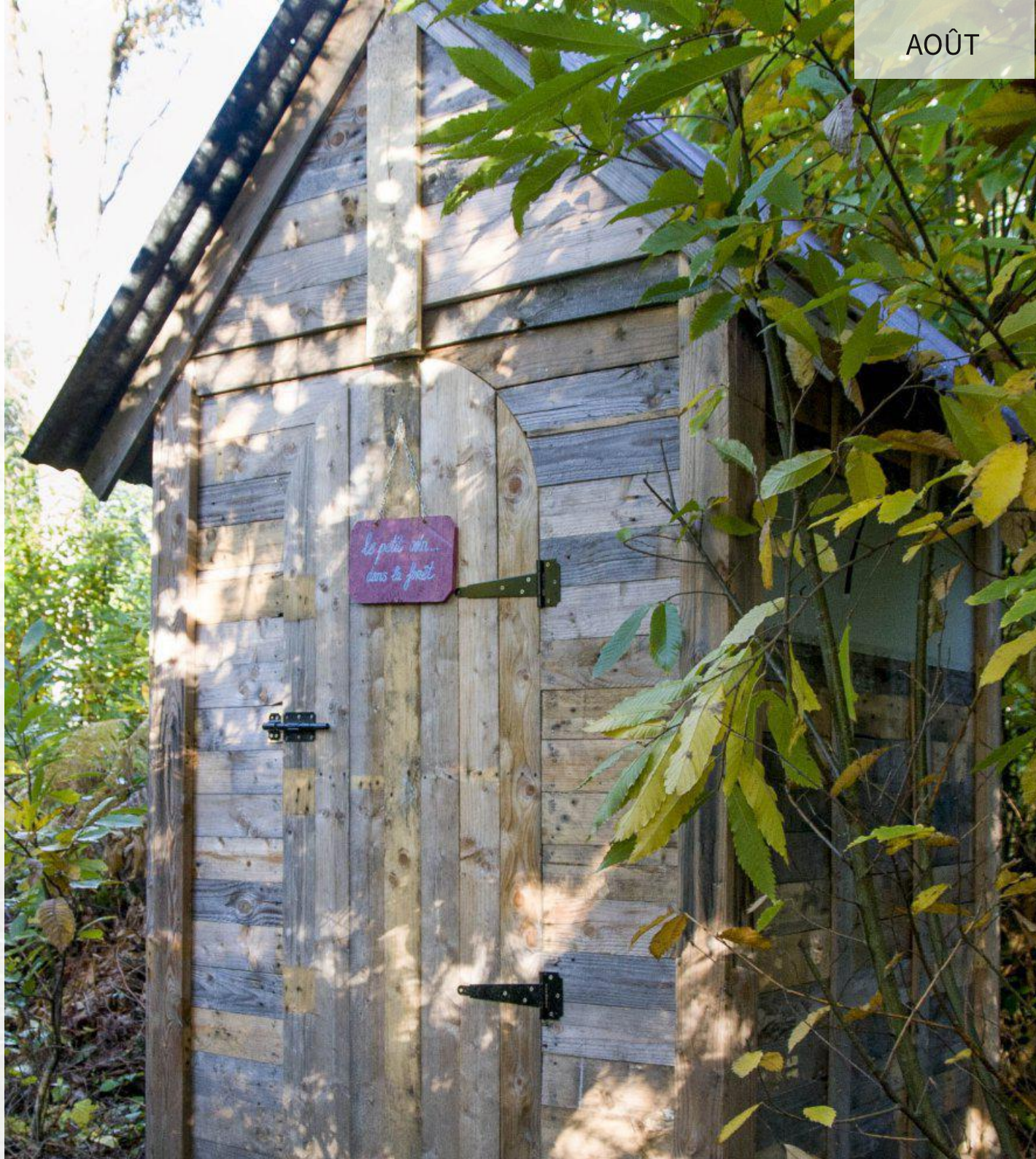
Photo : Les toilettes sèches, première cabane du terrain

Des projets communs s'inventent : magasin gratuit sur la mezzanine, tableau de prêt de matériel et événements divers. Le premier à être mis en place sera une projection des épisodes à la suite du marché hebdomadaire en novembre.