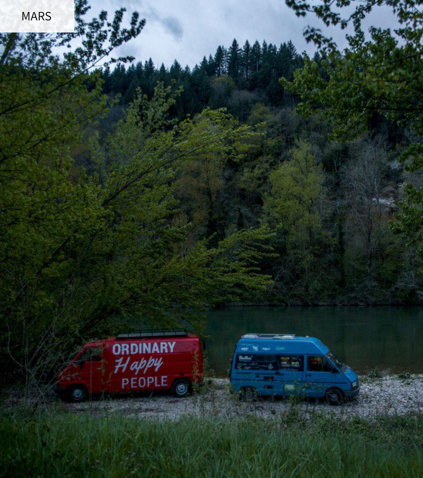
Photo : Le camion des deux projets Ordinary Happy People et SideWays au bord du Tarn, le 12 avril 2016

Il est temps pour nous de commencer à travailler plus sérieusement sur la post-production de l'épisode 9. Pendant six semaines, nous allons nous y atteler, interrompus ici et là par les rencontres, les projections et les découvertes variées.