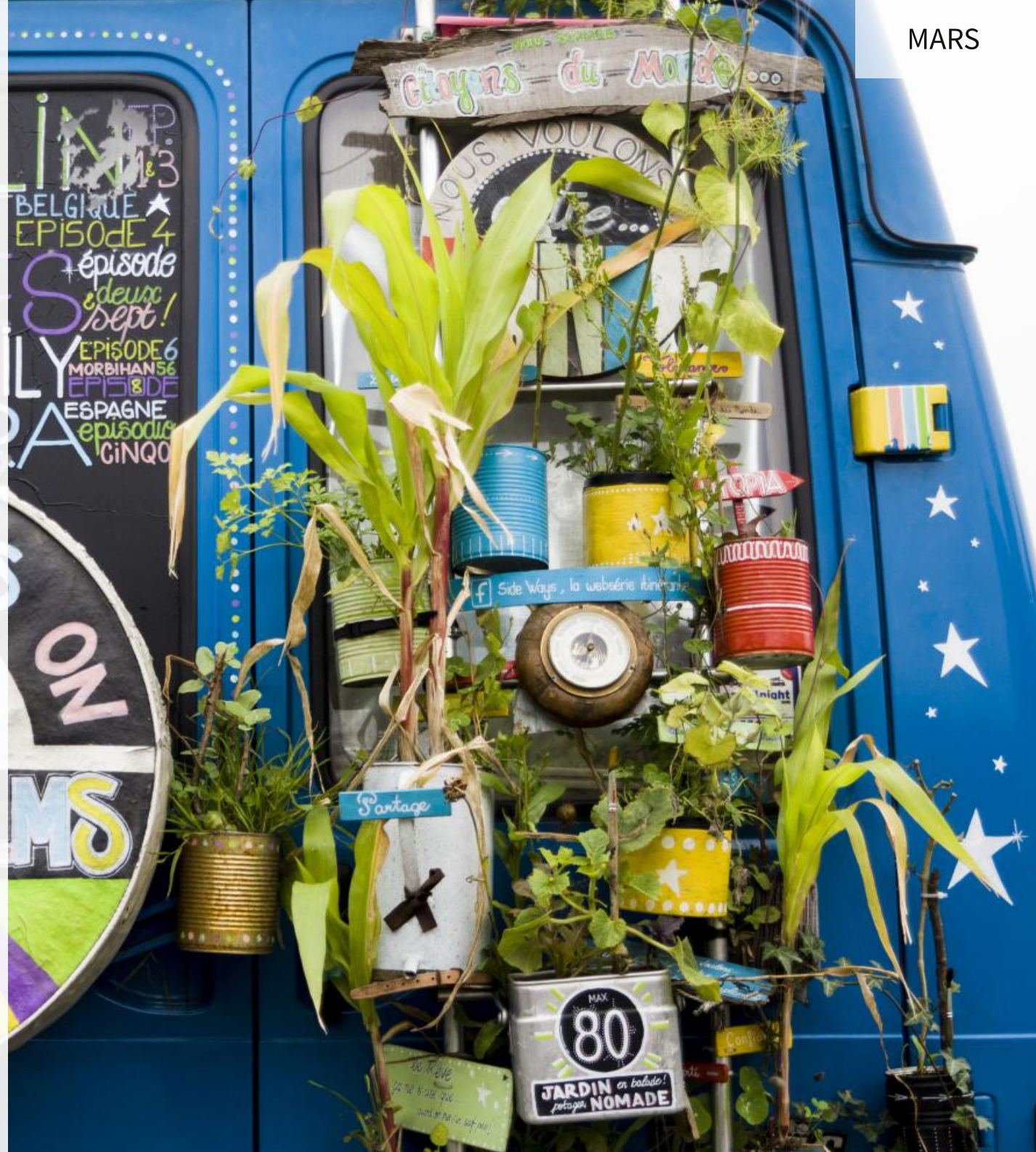
Photo : Le potager vertical du camion, le 30 août 2015