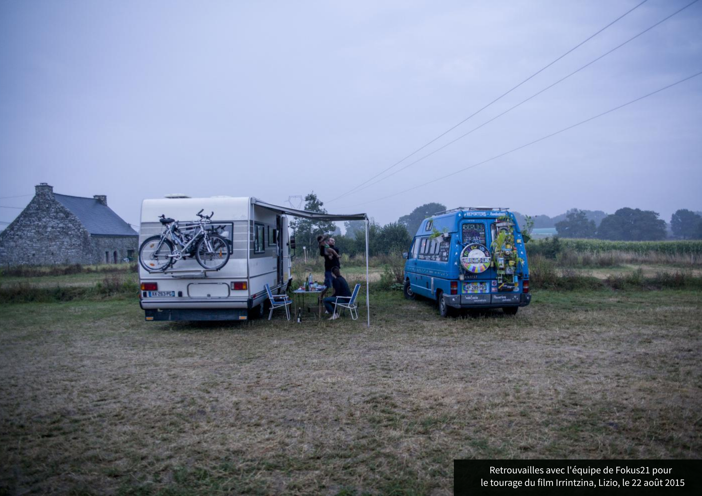
Retrouvailles avec l'équipe de Fokus21 pour le tournage du film Irrintzina, Lizio, le 22 août 2015