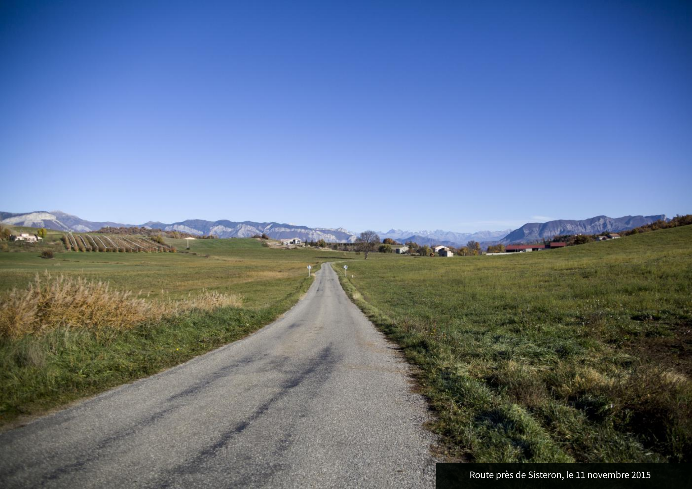
Route près de Sisteron, le 11 novembre 2015