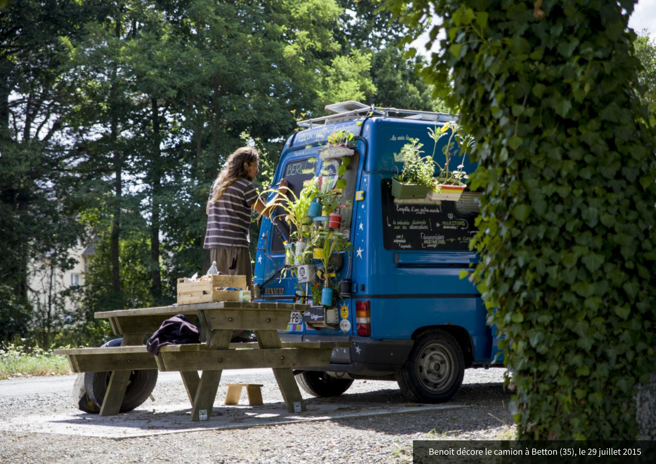
Benoit décore le camion à Betton (35), le 29 juillet 2015