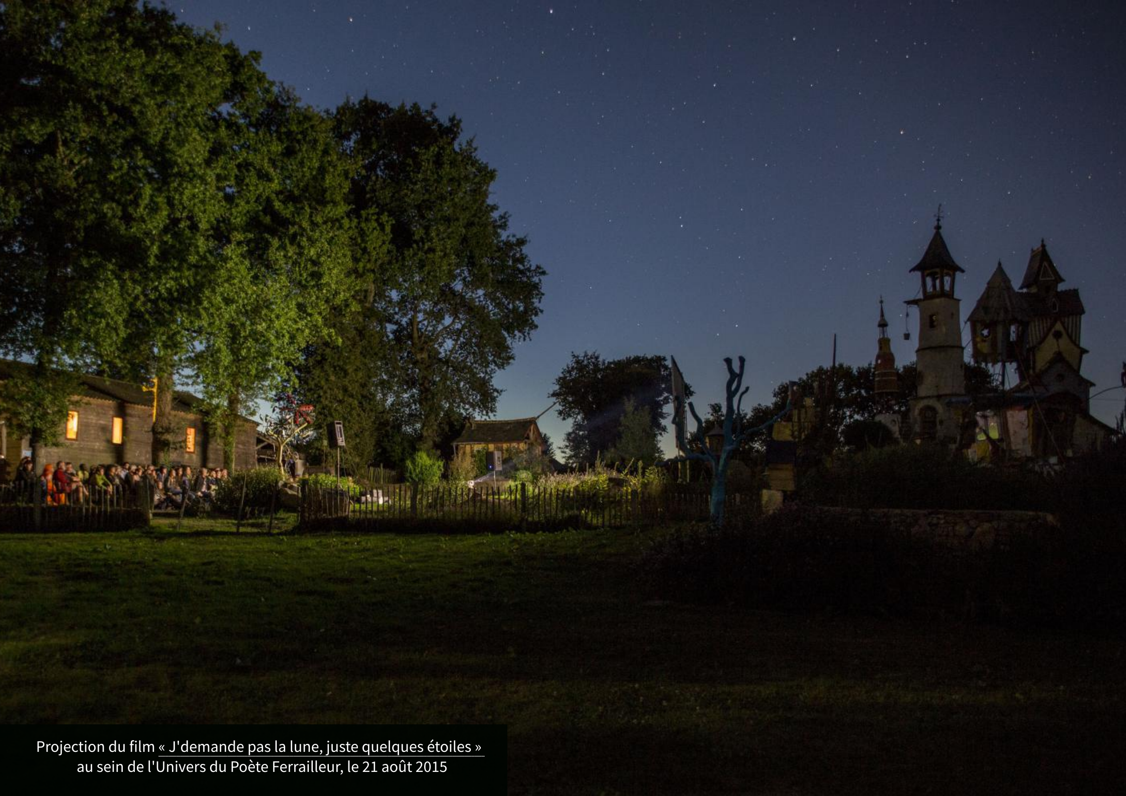
Projection du film « J'demande pas la lune, juste quelques étoiles » au sein de l'Univers du Poète Ferrailleur, le 21 août 2015