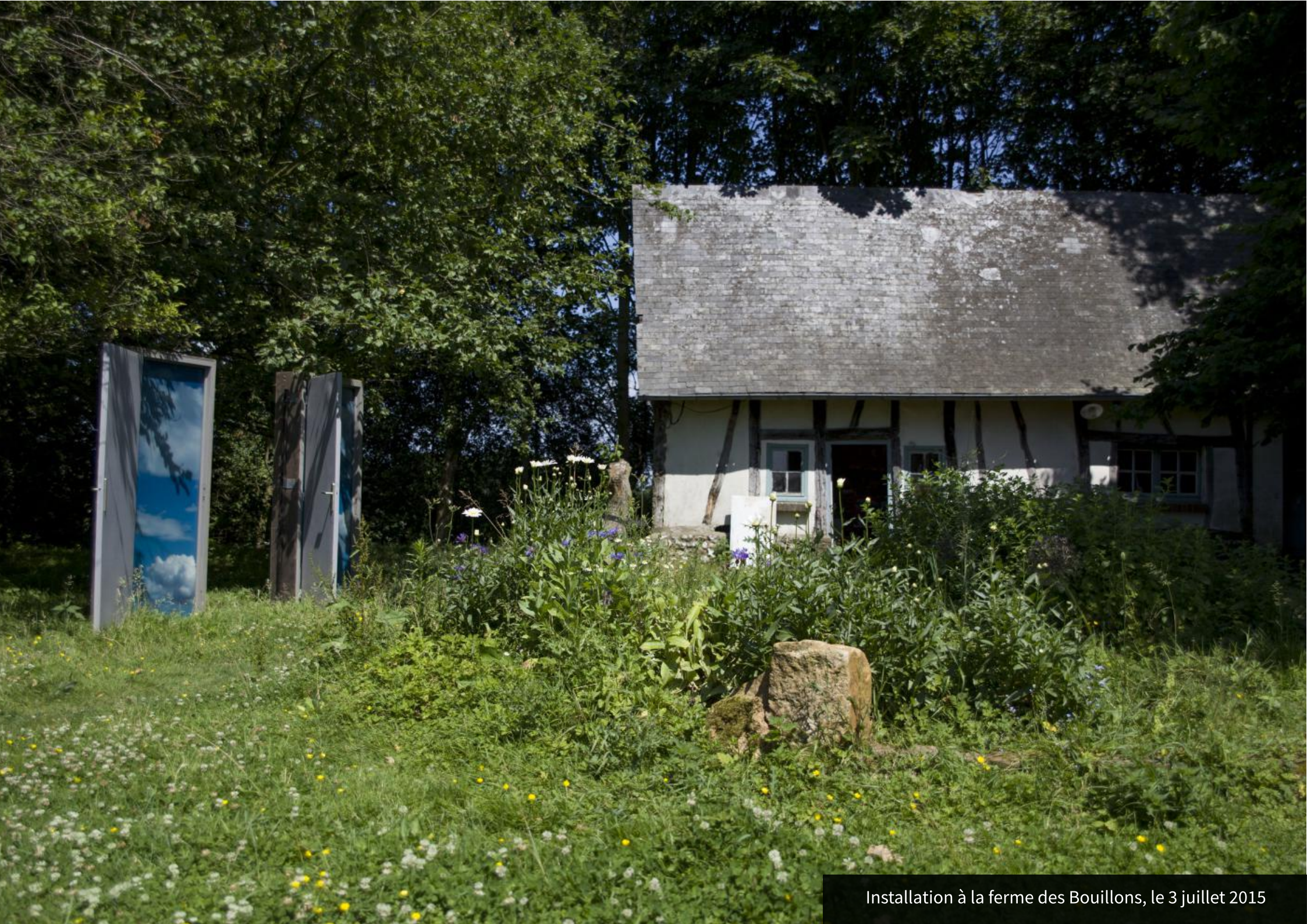
Installation à la ferme des Bouillons, le 3 juillet 2015