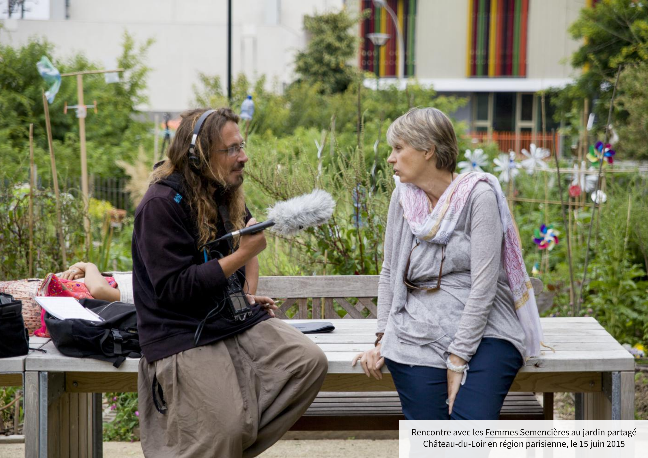
Rencontre avec les Femmes Semencières au jardin partagé Château-du-Loir en région parisienne, le 15 juin 2015