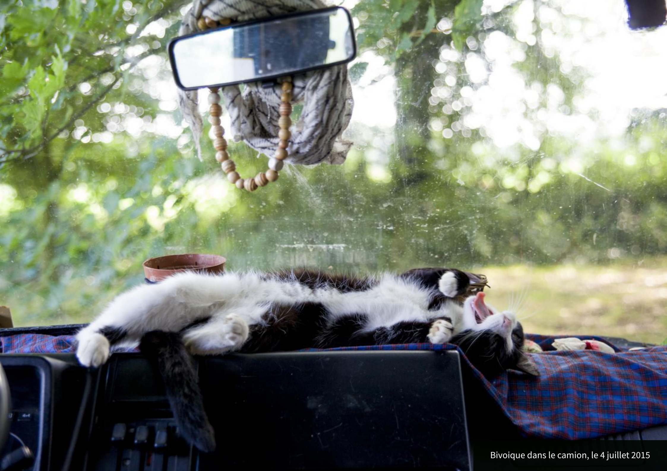
Bivoique dans le camion, le 4 juillet 2015