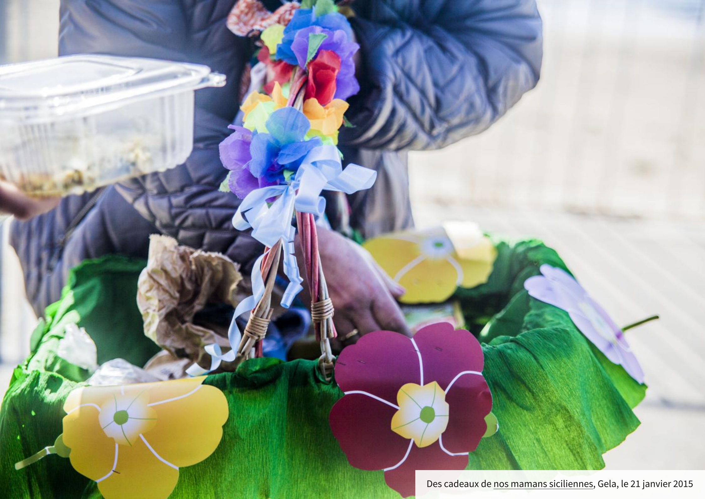
Des cadeaux de nos mamans siciliennes, Gela, le 21 janvier 2015