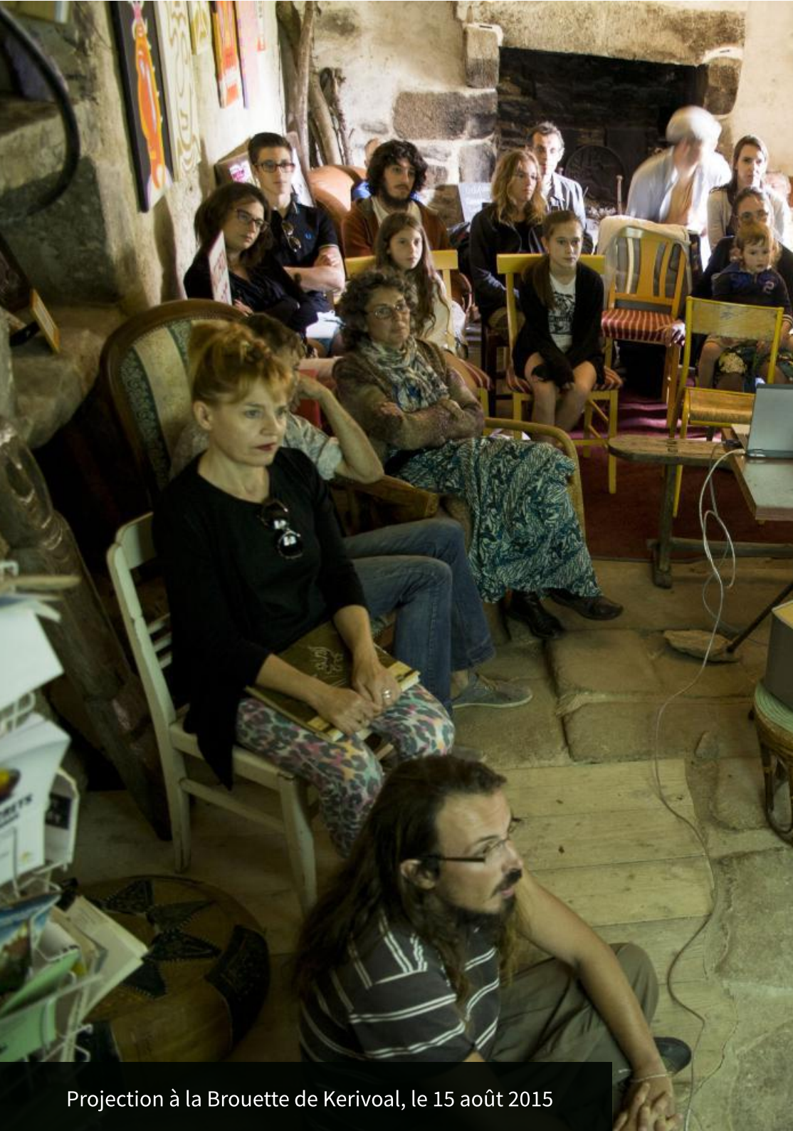
Projection à la Brouette de Kerivoal, le 15 août 2015