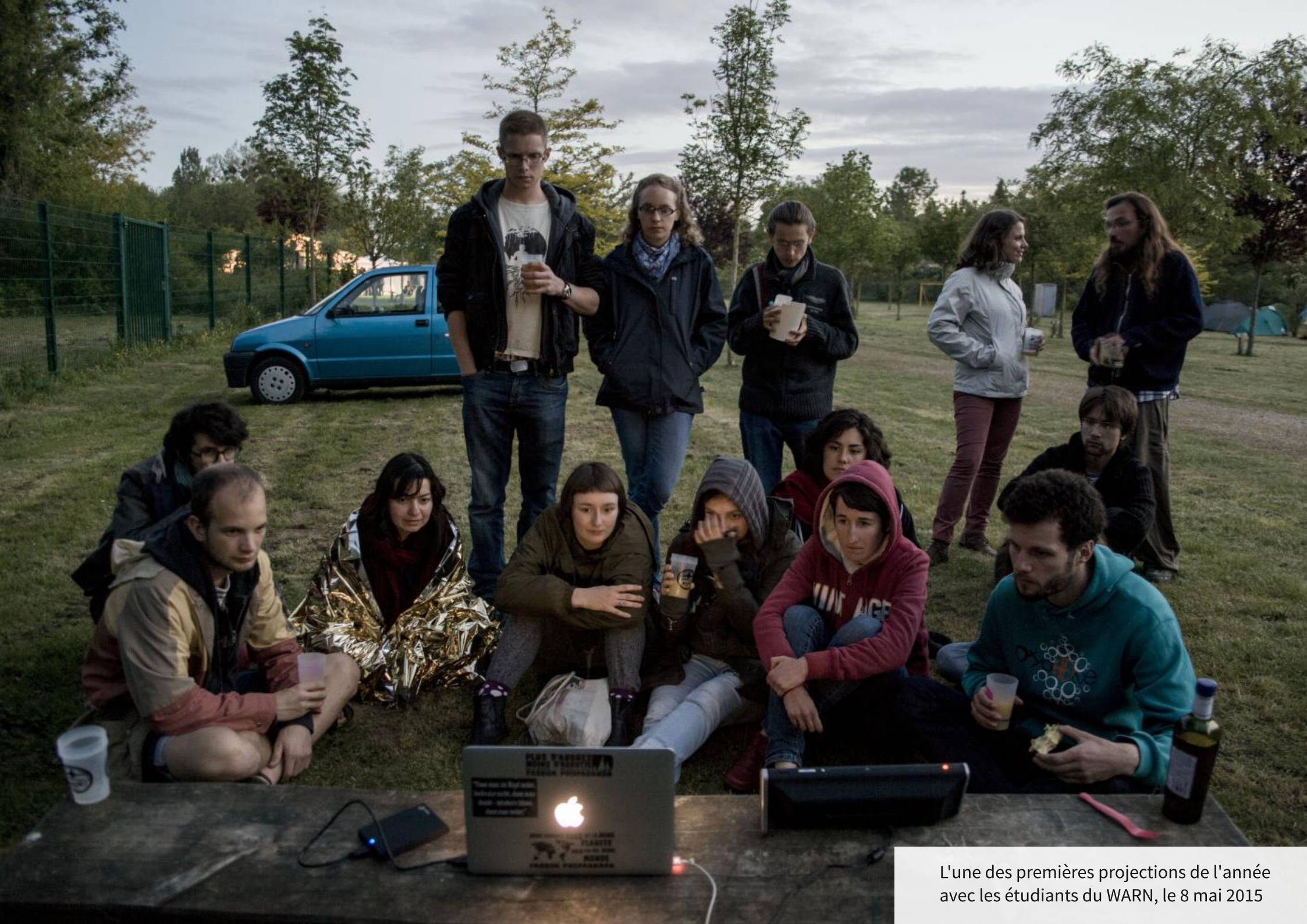
L'une des premières projections de l'année avec les étudiants du WARN, le 8 mai 2015